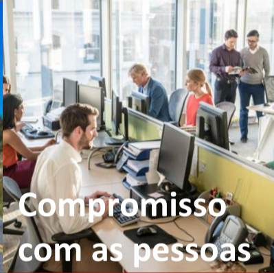
Compromisso com as pessoas

Conscientize-se sobre a Qualidade e competências para capacitar os funcionários.